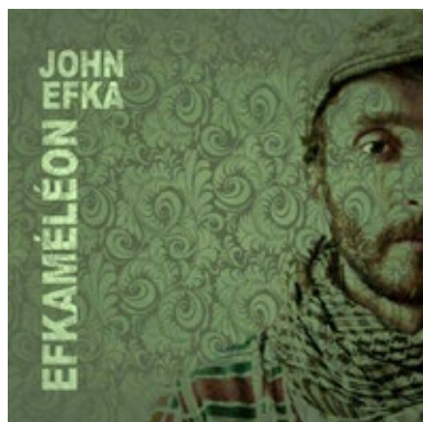
EP 5 Titres « Efkaméléon », sortie en 2014