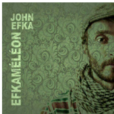
EP 5 Titres « Efkaméléon », sortie en 2014